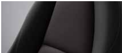
ריפוד בד שחור