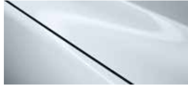
לבן קרמי (47A)