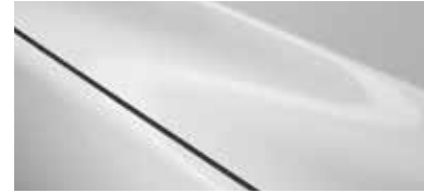
לבן פנינה (25D)