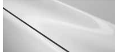
לבן פנינה (25D)