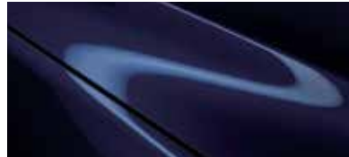
כחול קריסטל כהה (42M)