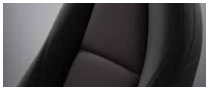
ריפוד בד בז'