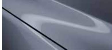
כחול מתכתי (47C)