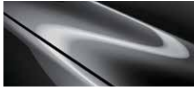
אפור עשיר (46G)*