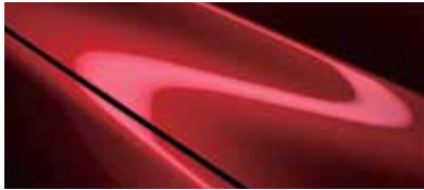
אדום עשיר נוצץ (46V)*