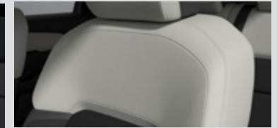
Leatherette Pure White משולב שחור