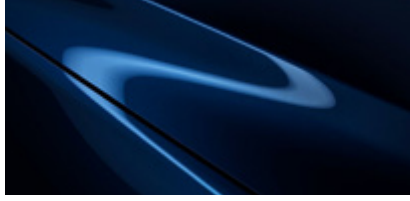
Navy Blue (52M)*