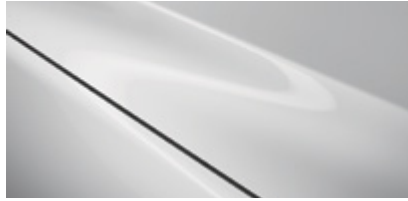
Rhodium White (51K)*