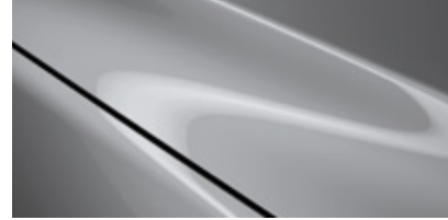
Aero Gray (52C)*