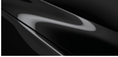
Jet Black (41W)*