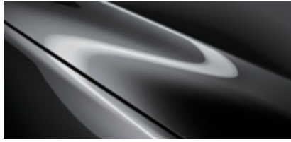
Machine Gray (46G)*