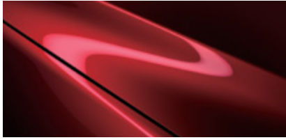
Soul Red (46V)*