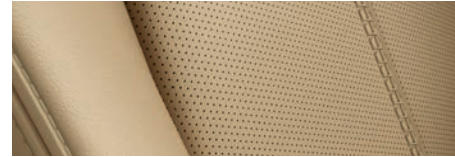
ריפוד עור Nappa Tan בגוון בז'