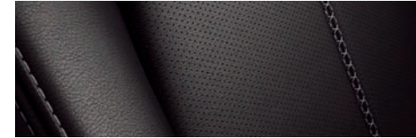
ריפוד עור שחור